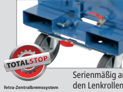
Serienmäßig an den Lenkrollen