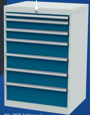
RAL 7035 lichtgrau/ RAL 5010 enzianblau