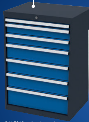
RAL 7016 anthrazitgrau/ RAL 5010 enzianblau

Sichere Zentralverriegelung mit FORUM-Schließanlage - diebstahlsicher